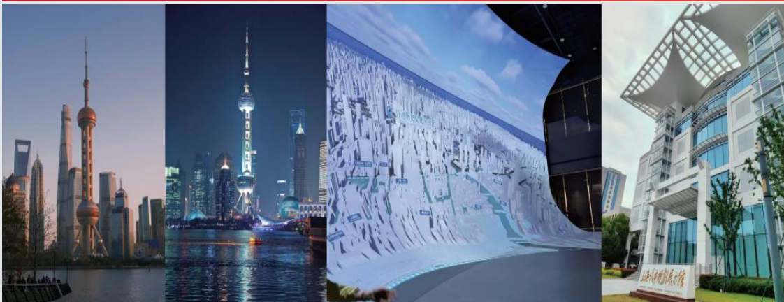
城市規劃館、東方明珠